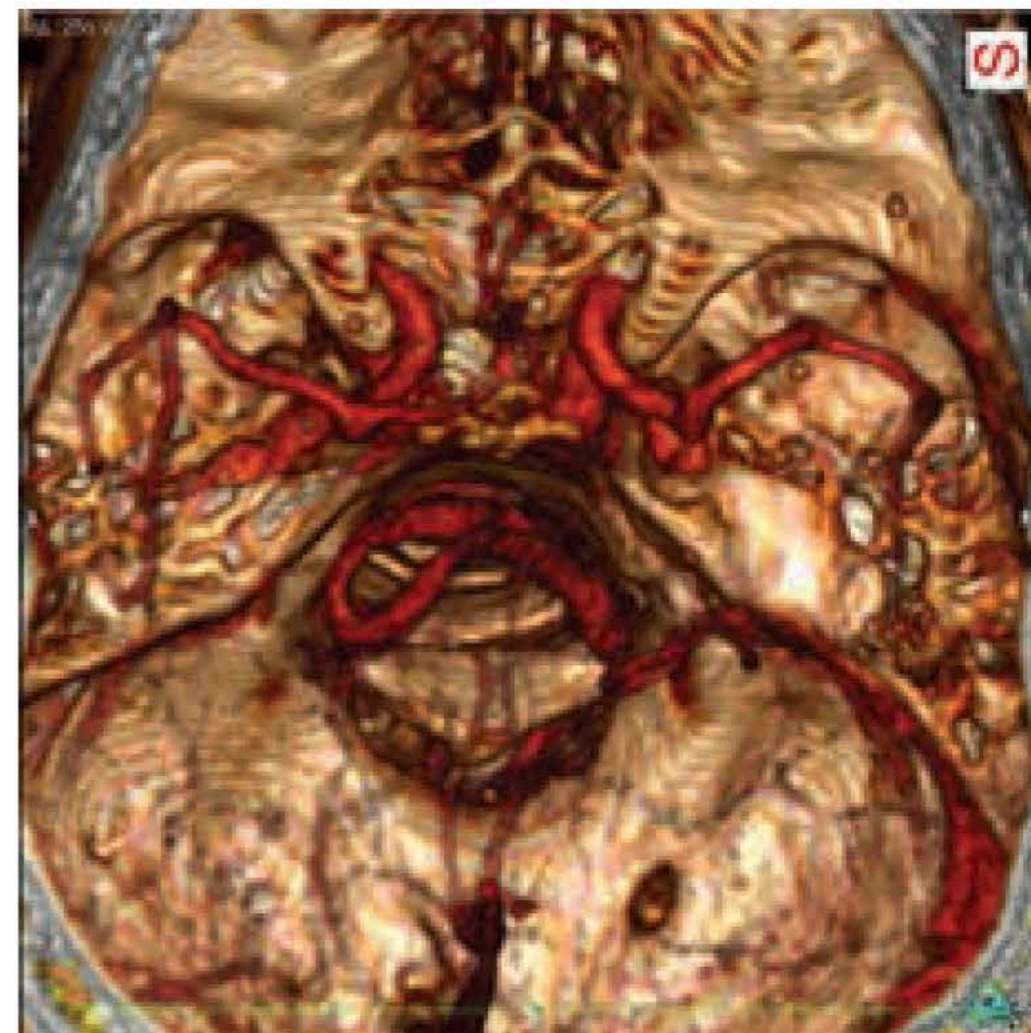
Polígono de Willis incompleto