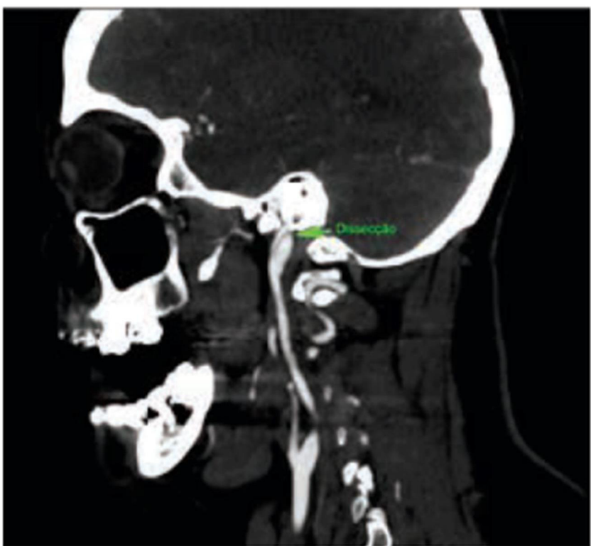
Reconstrução multiplicar com dissecção da carótida interna esquerda em transição extra/intra cerebral